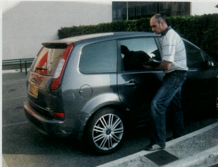
DÉFI L'évolution technologique des véhicules influe sur l'activité des experts, même si ce n'est que partiellement.